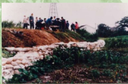
あわら市春宮1丁目付近